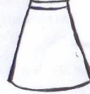
Sketi ya Michezo Njano